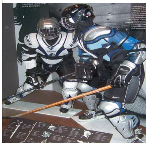
Équipement des joueurs de hockey présenté sur des mannequins.

Tout joueur doit porter un casque ; il peut être équipé d'une grille ou d'une visière.