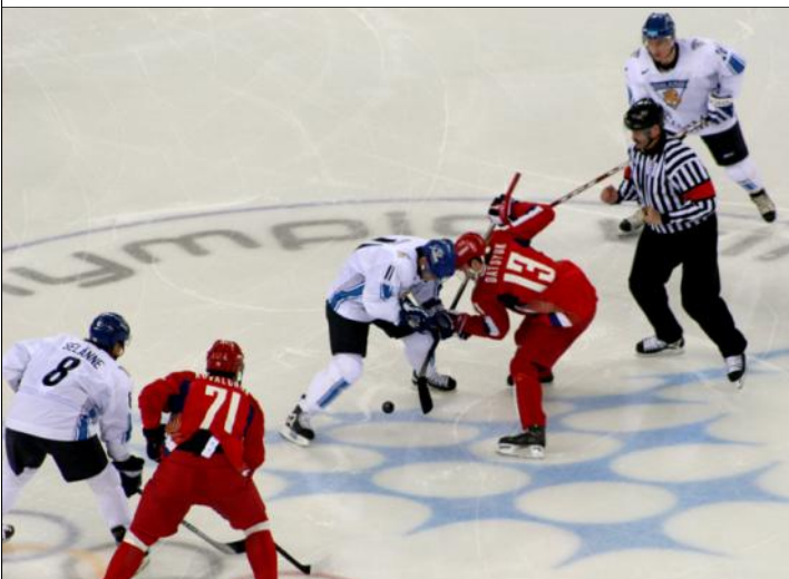
Demi-finale des JO 2006 entre la Finlande et la Russie.

Chacun se sert d'un bâton de hockey appelé crosse en France ou canne en Belgique et en Suisse.