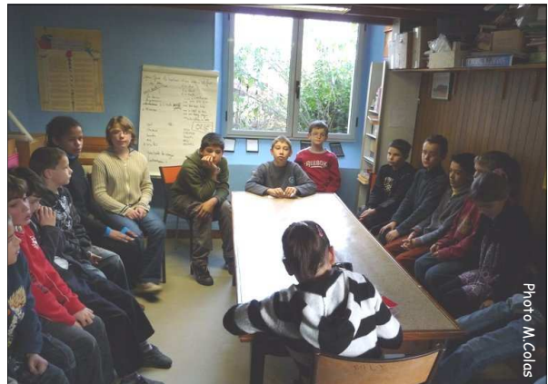
Conseil de coop : le président de la quinzaine est en face du secrétaire qui est de dos.

Nous discutons des problèmes de la classe et des choses qui marchent correctement. Nous pouvons préparer nos projets, discuter sur un sujet, parler de nos correspondants. Nous avons fait un débat sur les droits des enfants.